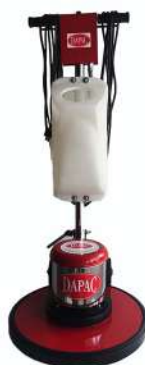
CD17 -T / CD20 -T

Velocidad: 175 rpm Motor: 1,5 hp Dimensión: 17" / 20"