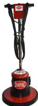
CD17 / CD20